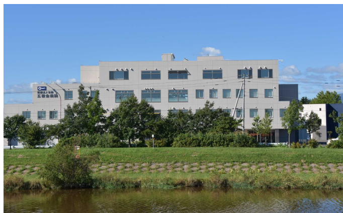
五稜会病院の正面です。台風一過の抜けるような青空です。大雨で伏古川も水かさが増えました。段々と秋景色が広がっていくのが見えてきます。